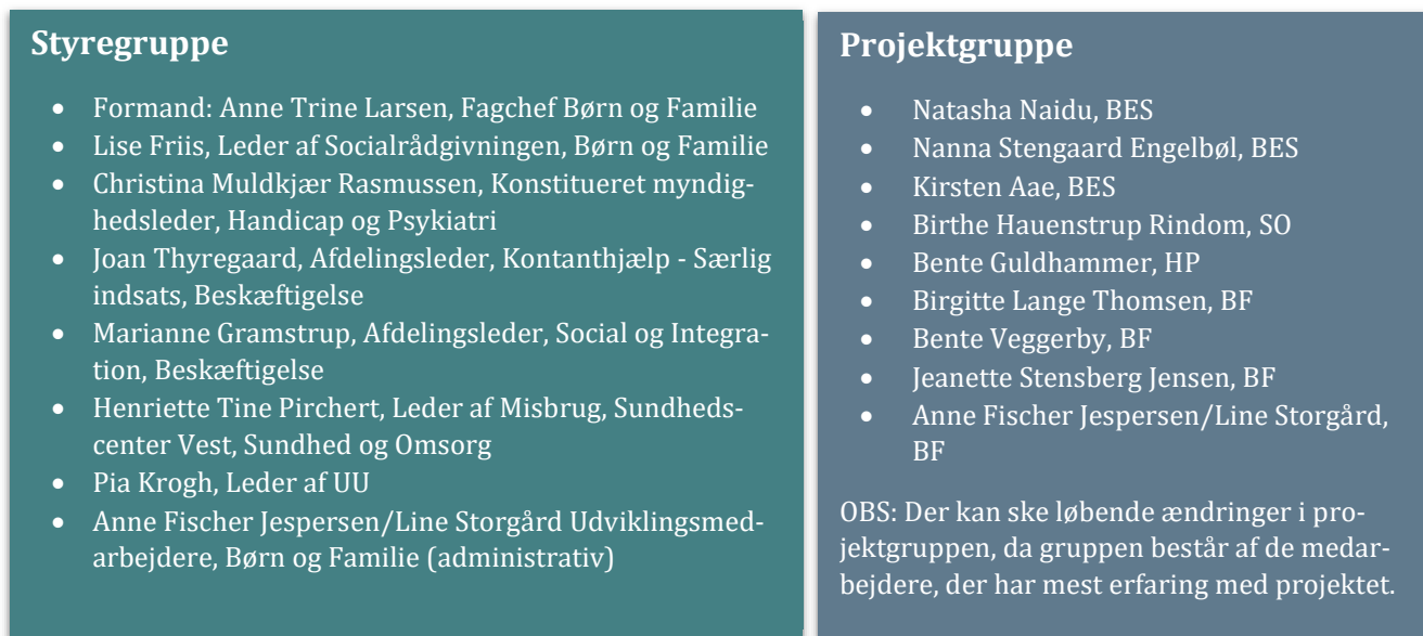
Figur 1. Samarbejdspartnerne organiseret illustreret.